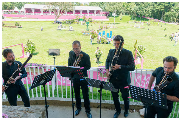
QUATUOR ARUNDO FESTIVAL OFF