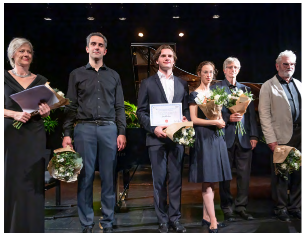
Concours international pour les pianistes amateurs